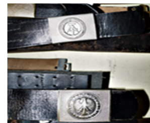
Dienstkeppel NVA und Bw