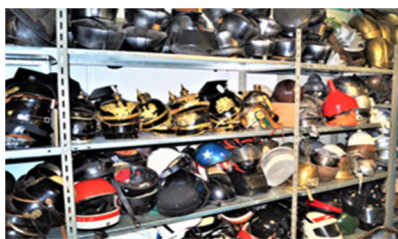
Von preußischen Pickelhauben über Stahlhelme bis zu Motorradhelmen...