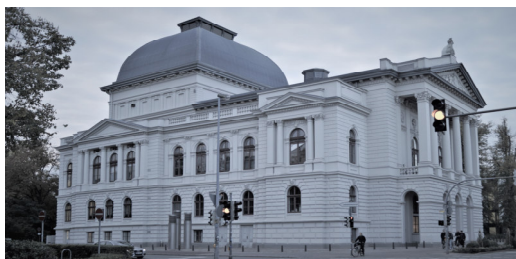
Das Oldenburgische Staatstheater

Anmeldung bitte bis zum 22.02.2023 an unsere Geschäftsstelle per eMail oder Telefon.