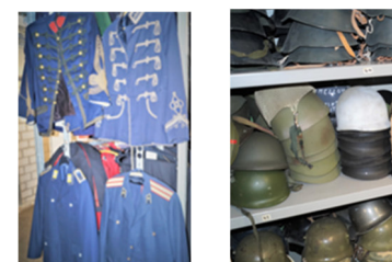
Historische und aktuelle Uniformen