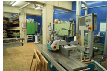
Blick in die Schreinerwerkstatt