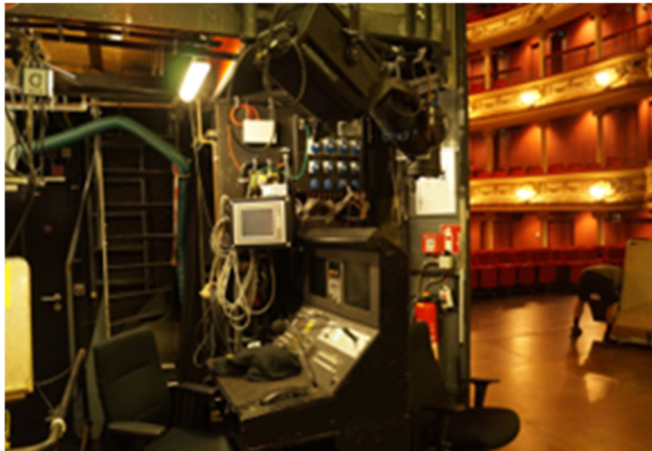
Hinter der Theaterbühne mit Blick in den Zuschauerraum

Die nachstehenden Fotoaufnahmen von einem Besuch des Theaters im Oktober 2019 zeigen ein paar Eindrücke von den Werkstätten und dem Fundus (Kulissen, Requisiten und Kostüme). Insbesondere beim Blick in die Waffen- und Wäschekammern war ich im erstaunt, in welchem Umfang im Theater u.a. auch militärische Uniformen und Waffen eingelagert sind.